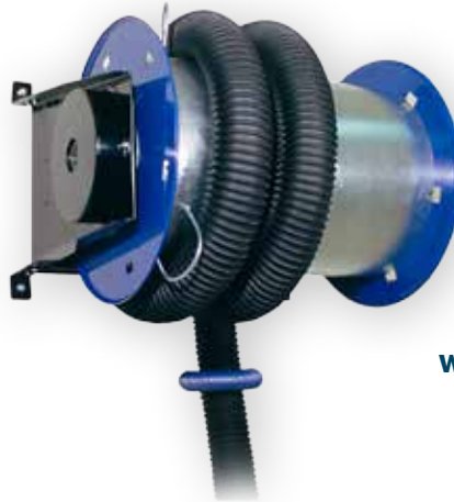
Wandhouder voor uitlaatgasslang